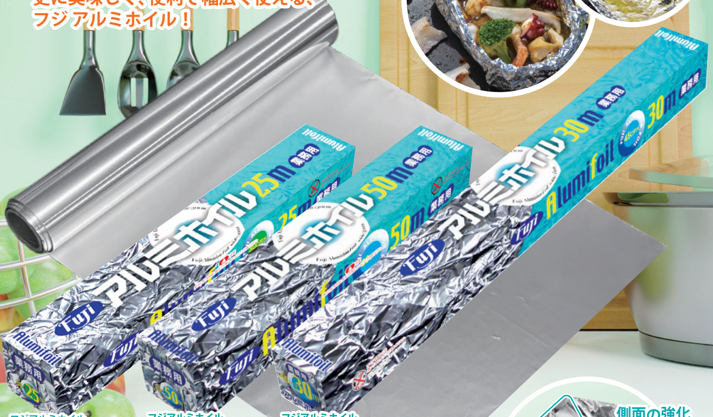
フジアルミホイル 30cm×25m