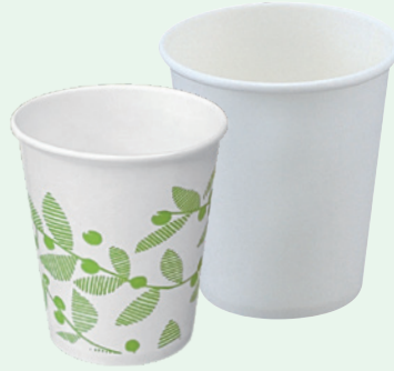
スーパー紙コップ5～7oz白/5ozリーフ柄