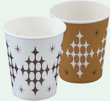
紙コップ7ozスター柄/ブラウン柄