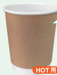
二重紙コップ280未晒し