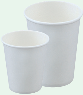
紙コップ 2～9oz 白