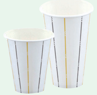
紙コップ7～18ozドリンクカップ