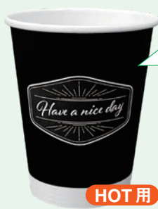
厚紙コップ280ブラック

両面 ラミネート加工 両面ラミネート加工でカラーは高級感のある、ブラックのシブいデザイン。様々な用途に、お使いいただけます。