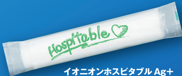
イオニオンホスピタブル Ag+

生地を大きく厚く仕上げておりますので、拭き心地が良く手も汚れません。清拭用としてしっかり汚れを拭き取れ、肌に優しく、しっとりとした感触を残します。