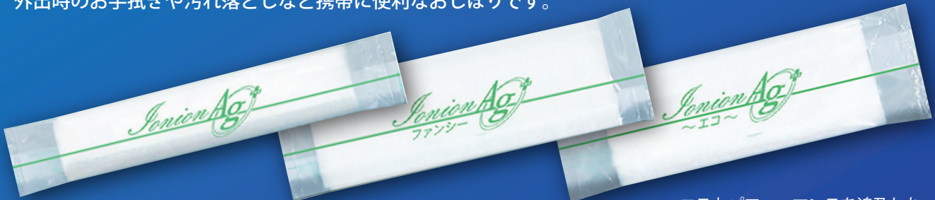
ちょうどいいサイズの丸型おしぼり イオニオン Ag+ (丸)

手や口周りのちょっとした汚れ拭き取りに最適な大きさです。外出時のお手拭きや汚れ落としなど携帯に便利なおしぼりです。