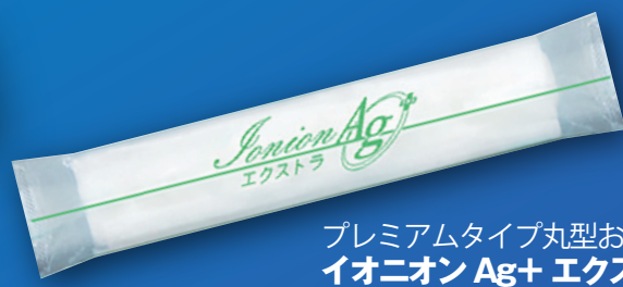
プレミアムタイプ丸型おしぼり イオニオン Ag+ エクストラ