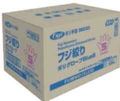
外箱サンプル画像

本品は食品衛生法・食品、添加物等の規格基準第3のD 器具若しくは容器包装またはこれらの原材料別規格 (昭和34年12月28日厚生省告示第370号及び平成18年 3月31日厚生労働省告示第201号)に適合しています。