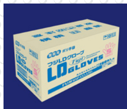
外箱サンプル画像

本品は食品衛生法・食品、添加物等の規格基準第3のD器具若しくは容器包装またはこれらの原材料別規格(昭和34年12月28日厚生省告示第370号及び平成18年3月31日厚生労働省告示第201号)に適合しています。